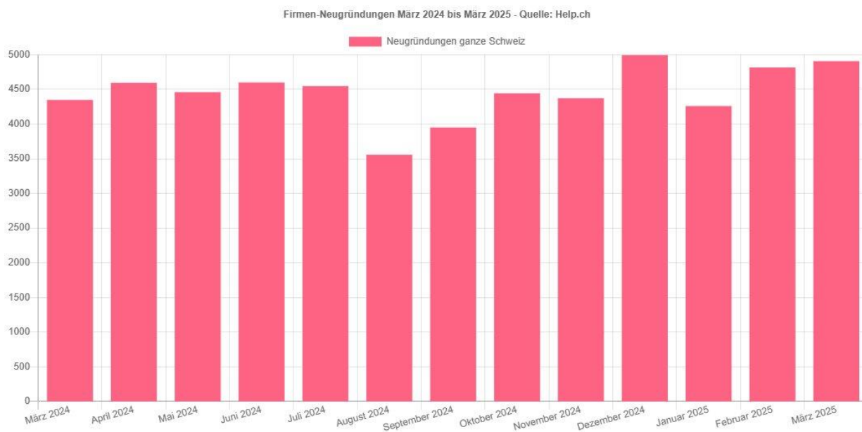
Chart Neugründungen: Vergleich der letzten Monate

Die Zahlen spiegeln das anhaltend hohe Interesse an unternehmerischer Tätigkeit und die Attraktivität des Standorts Schweiz für Start-ups und Neugründungen wider.